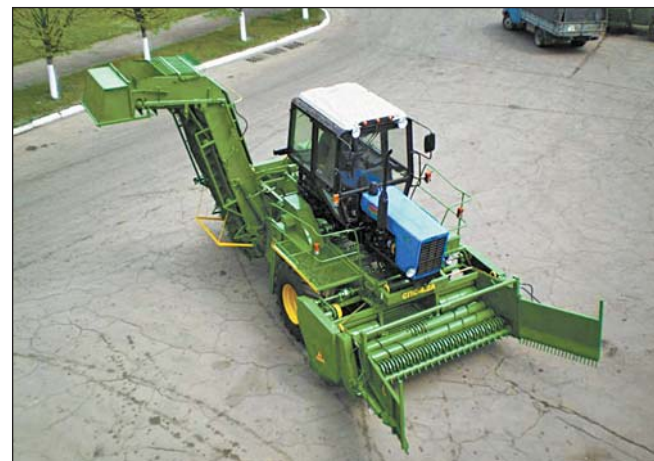
Свеклопогрузчик СПС 4-2А

Свекломойки также реализуют ООО «Группа компаний Техинсервис» (Киев, пер. Макевский, 1, тел. 8-044-251-1068), ОАО «Джуринский машиностроительный завод» (Джурин Винницкой обл., ул. Заводская, 1, тел. 8-04344-23177), ОАО «Купянский машиностроительный завод» (Купянка Харьковской обл., ул. Комсомольская, 38, тел. 8-05742-55832).